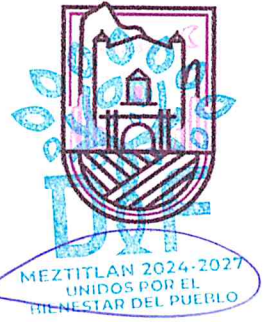
L.C.C. Yarytsy Cabrera Torres Subcomité de Planeación y Desarrollo Municipal

AYUNTAMIENTO MUNICIPAL 2024-2027 METZTITLÁN, HIDALGO